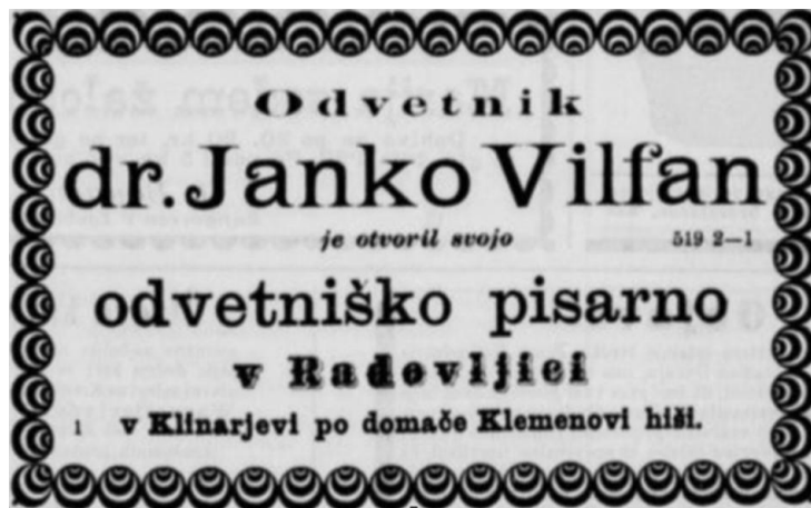
Odvetniška pisarna v Klemenovi hiši, 1894