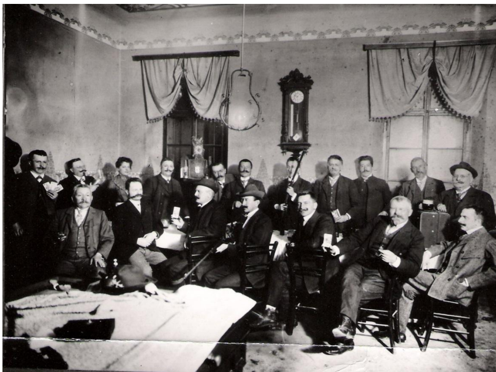
Interier gostilne Hudovernik, pred 1. sv. vojno Vir: Občina Radovljica

Vir: 1. Splošna naslovna knjiga za Kranjsko 1912 (založila Mulley - Kamenšek, Ljubljana).