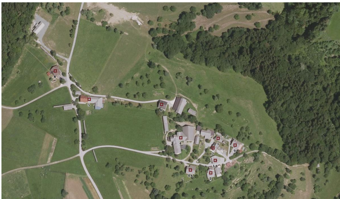
Peračica – orto-foto posnetek, 2016