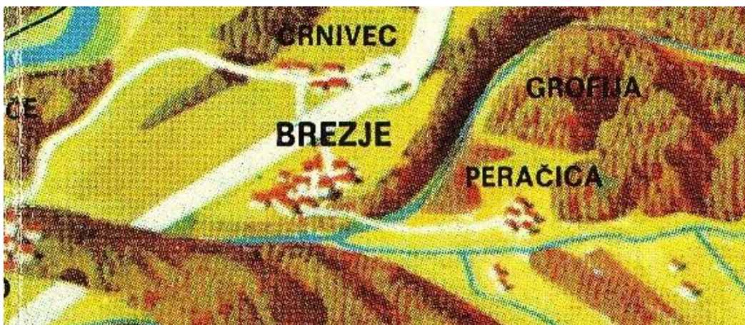
Pozicija Peračice, 1975