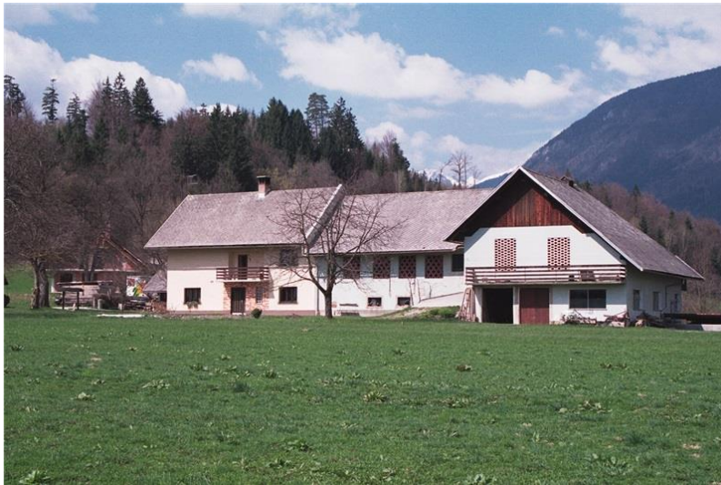
Pri Zadneku

Življenja Gorenjcev – Janez Langus (1:17.18)