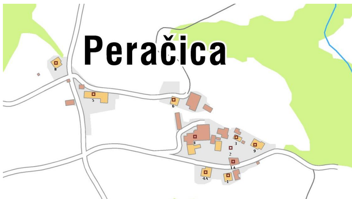
Peračica – topografska karta, 2016