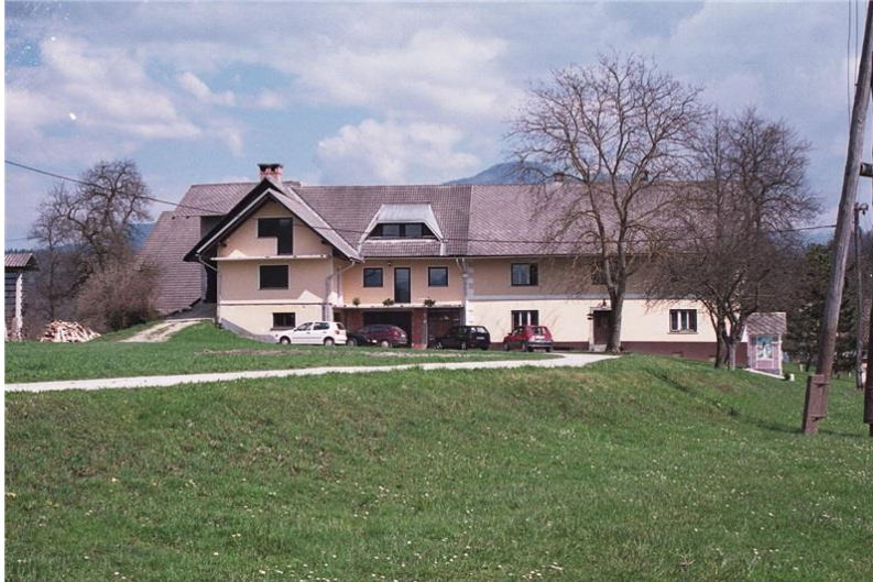
Pri Cvenkelnu