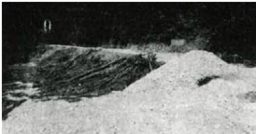
Gradbeno najbolj zahteven je prvi usad pri Poparju

Že kmalu po začetku del so ugotovili, da pri prvem usadu dela ne bodo mogla potekati po projektu, saj je na celotnem območju v globini dobrih šest metrov veliko talne vode. Zato bodo morali najprej urediti odvodnjavanje na obeh straneh ceste, odsek pa bodo sanirali po etapah.