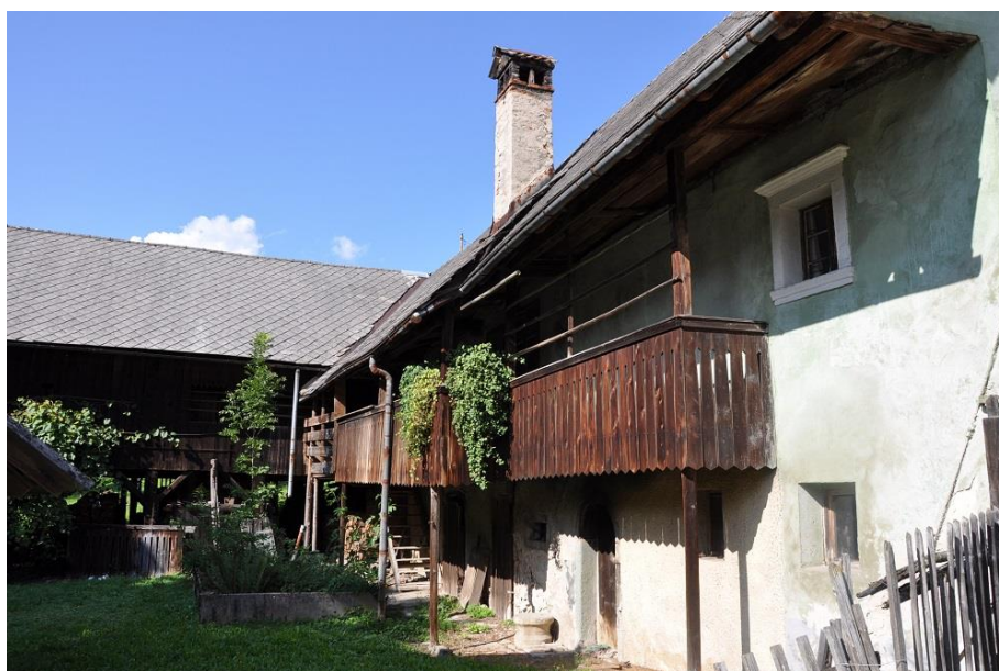
Katrinekova hiša, 2011