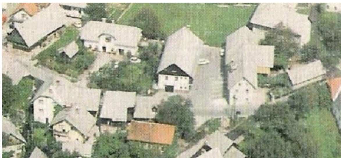
AMD Radovljica, ok. 1980 Op.: Od leve: Šander, Oparnik, AMD Radovljica, Katež, Benč (zadaj).