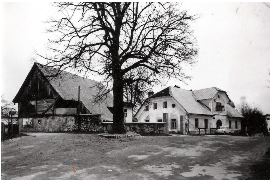
Gospodarstvo poslopje in bivša gostilna Hiršman, ok. 1960