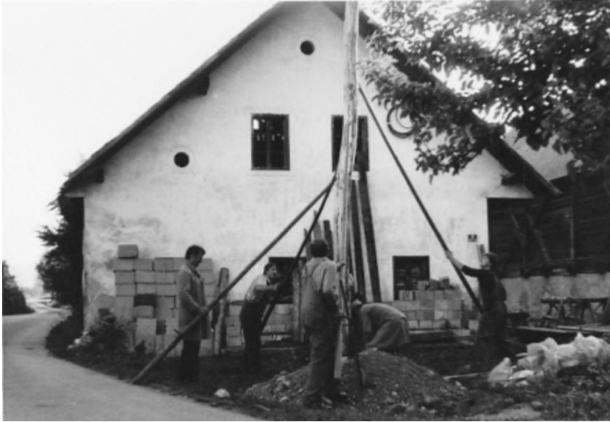
Bavantova hiša – delavci elektra postavljajo električni drog, 1981