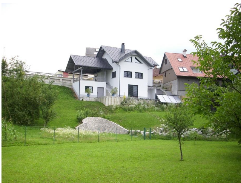
Globočnikova nova hiša, 2014 Op.: Nova hiša je »zrasla« na mestu starega Raščevega skednja!