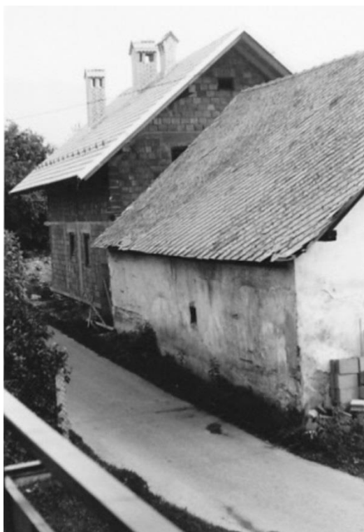
Novi in stari Bavant, 1981