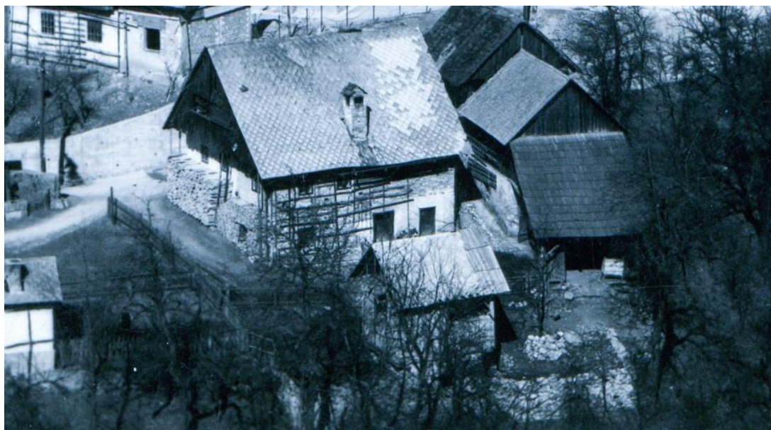
Stara Motlova hiša, ok. 1930 (detajl)