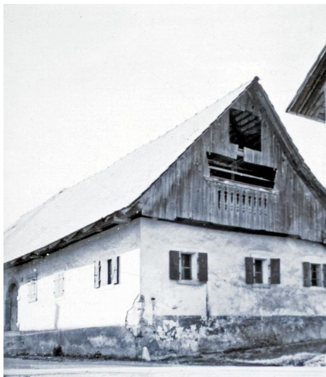
Tripotova hiša, ok. 1965