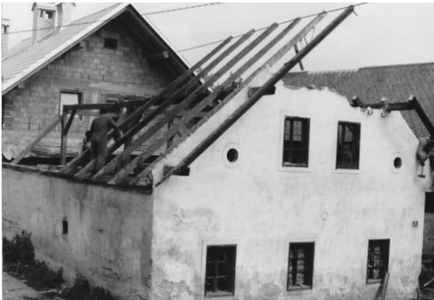
Podiranje Bavantove stare hiše, 1981

Op.: Na fotografiji so delavci Elektra, ki postavljajo drog ulične svetilke v Jalnovi ulici.