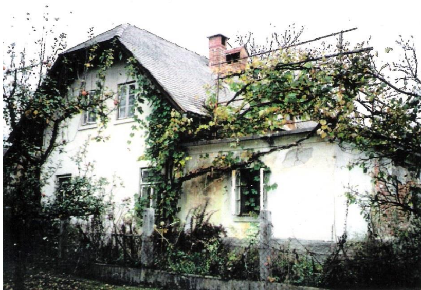
Tinova hiša pred rušitvijo, 1993