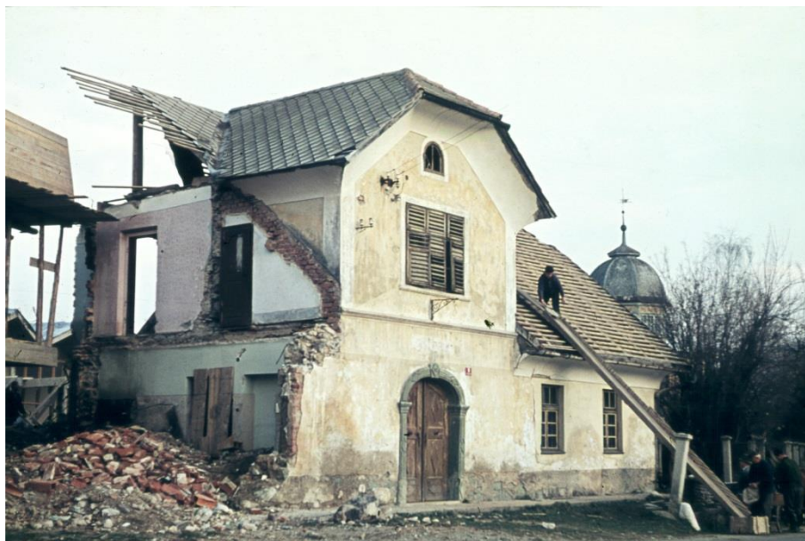
Podiranje stare gostilne Hiršman, 1970