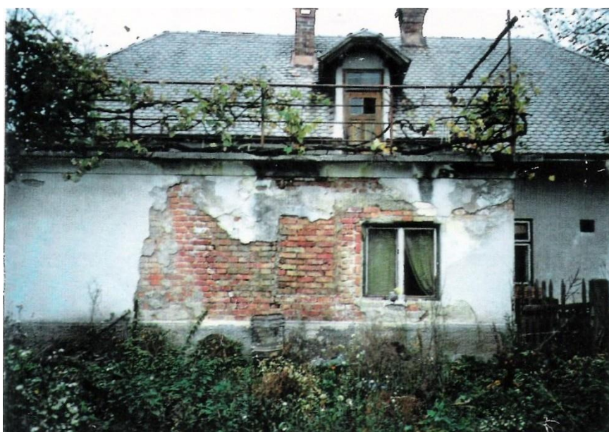
Tinova hiša pred rušitvijo, 1993