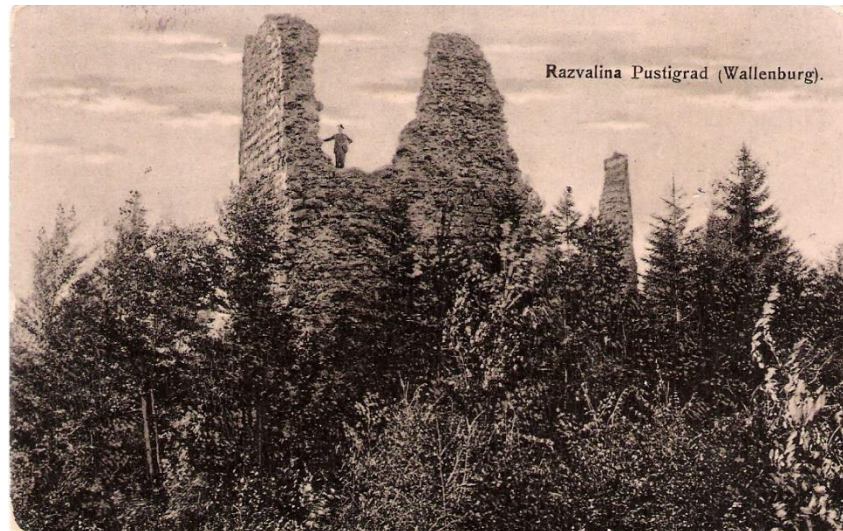
Razvaline Pustega gradu, ok. 1900

Vir: Trgovina in obrt v Radovljici do 17. stoletja (avtor Ferdo Gestrin, Radovljiški zbornik 1995).