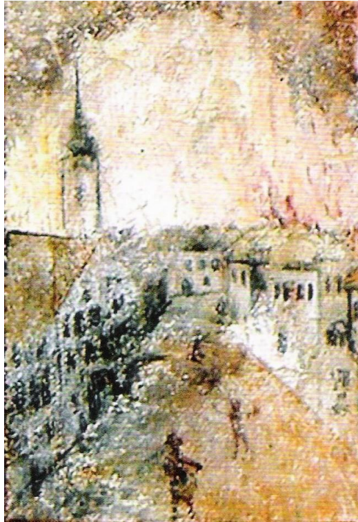
Požar v Radovljici, 1835