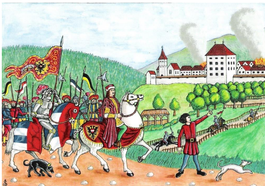
Cesarska vojska pred gorečo Radovljico, 1457

Vir: 550 let od bitke za Radovljico (avtor Stane Adam / Linhartovi listi št. 22-23, 2006)