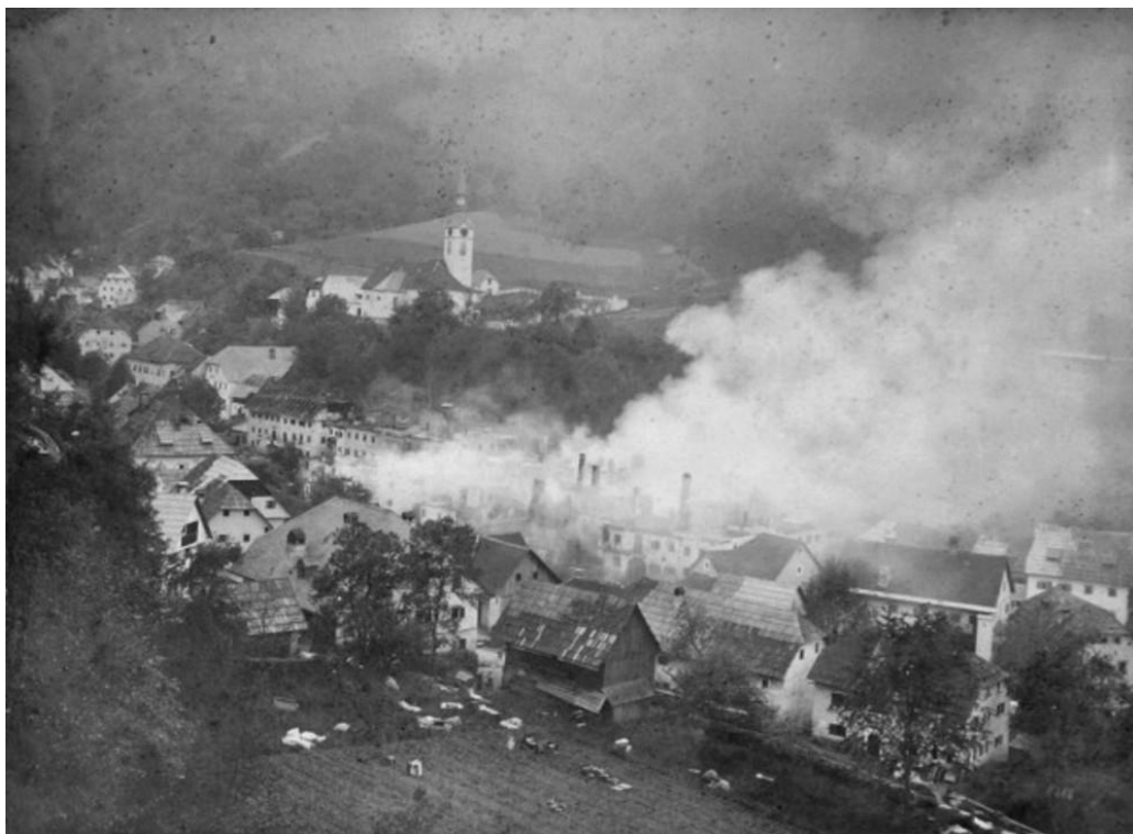
Požar v Kropi, 1901

Vir: DAR (Ažbe Toman; foto Alojz Vengar)